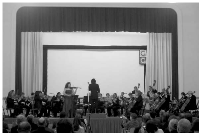
Konzert Frühjahr 2011 im gut besuchten Festsaal des Goethe – Gymnasiums.