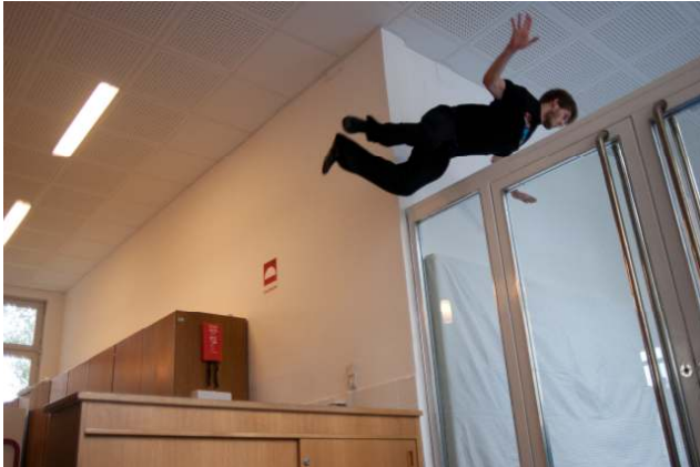
Sprung über die Glastüre beim Festsaal