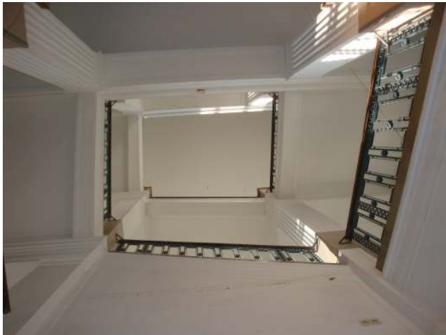
Stiegenhaus vor dem Lifteinbau.

Es ist so weit. Der seit über 10 Jahren geplante Lift im Hauptstiegenhaus ist fertig und in Betrieb.